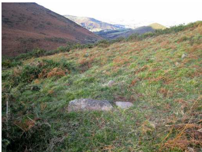
25 de noviembre de 2.009.