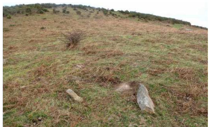
30 de enero de 2.013.