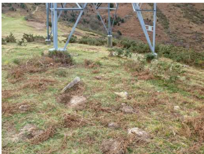
30 de enero de 2.013.