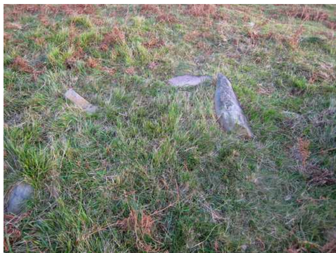
25 de noviembre de 2.009.