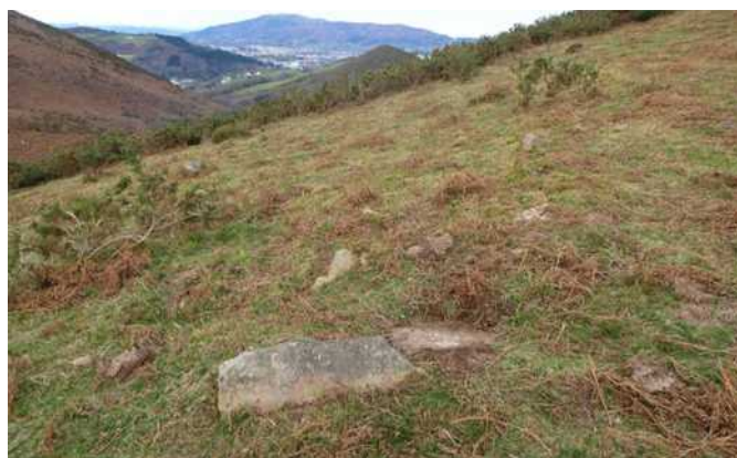
30 de enero de 2.013.