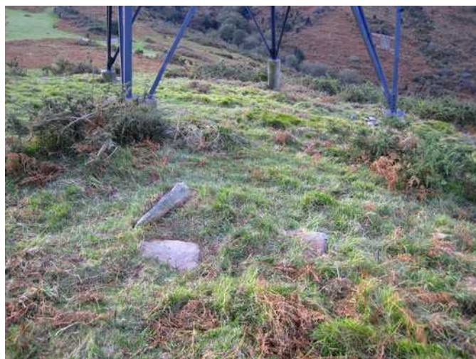
25 de noviembre de 2.009.