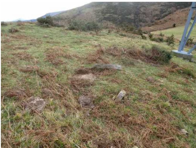
30 de enero de 2.013.