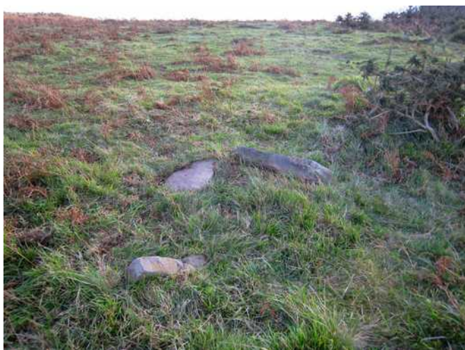
25 de noviembre de 2.009.