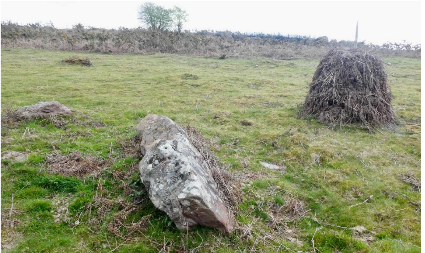
27 de Abril de 2.022.