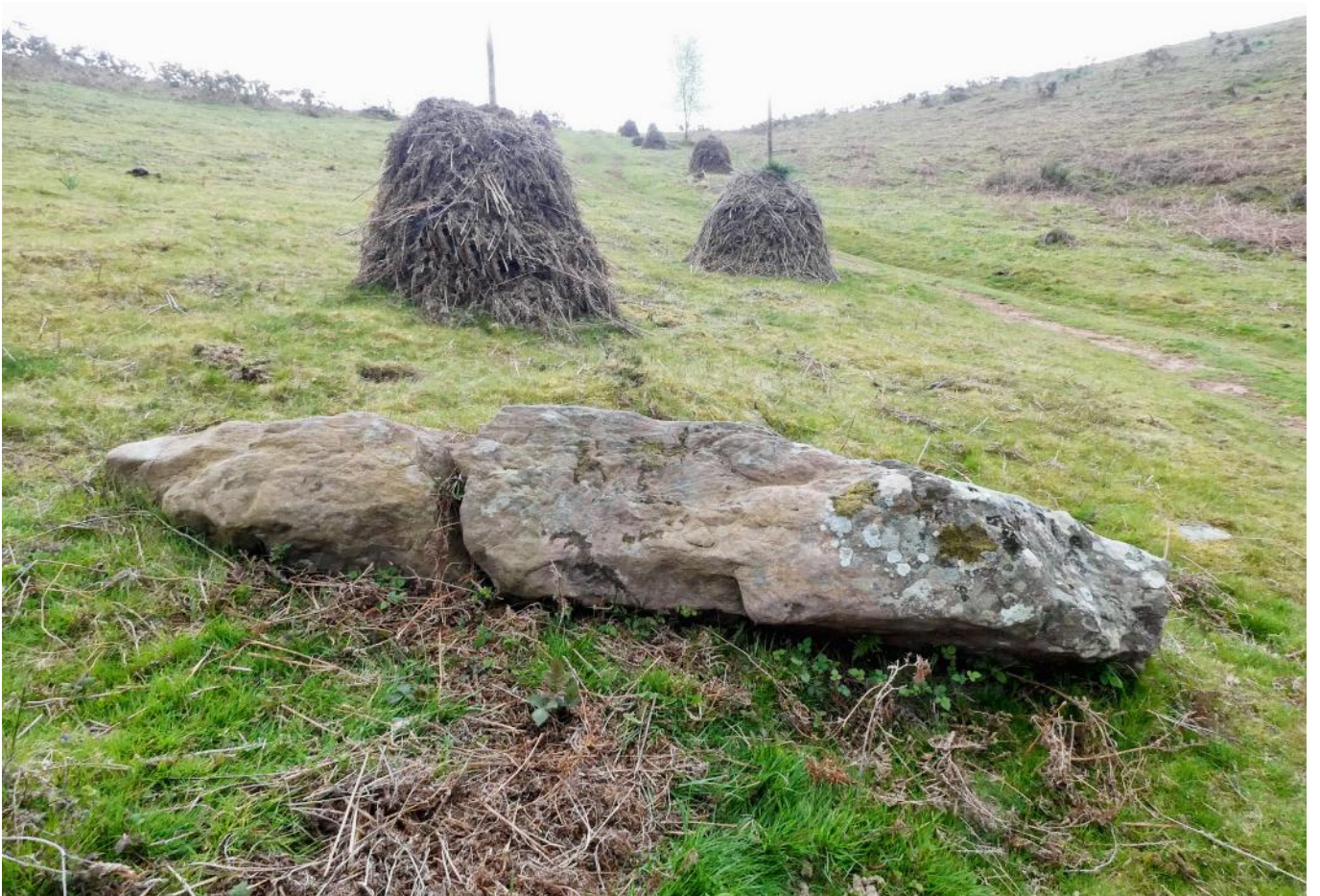
27 de Abril de 2.022.