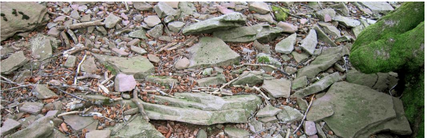
08 de Enero de 2.011.