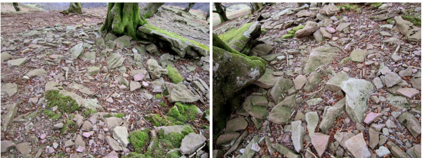
08 de Enero de 2.011.