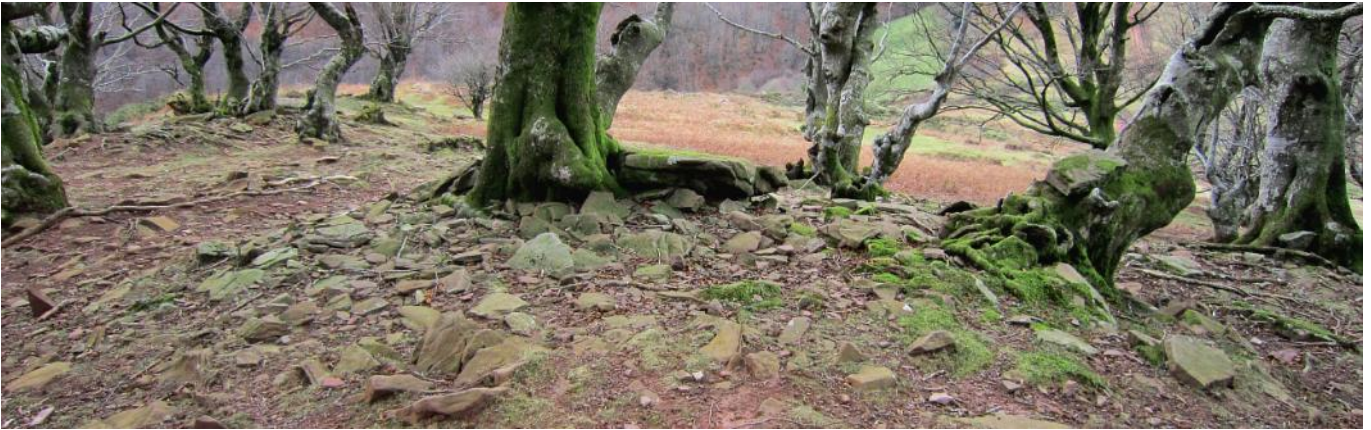
08 de Enero de 2.011.