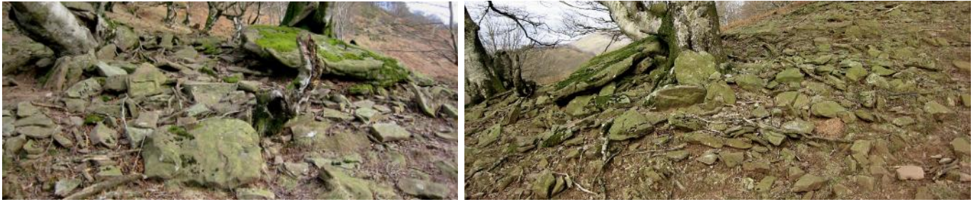
22 de Diciembre de 2.007.