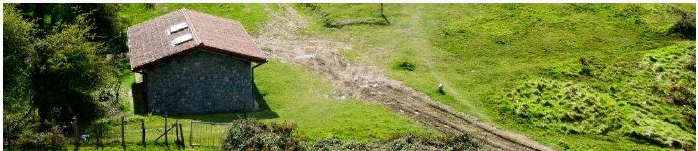
11 de Mayo de 2.021.