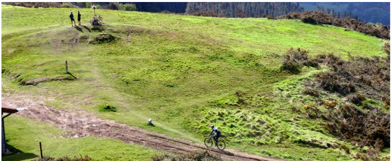
11 de Mayo de 2.021.