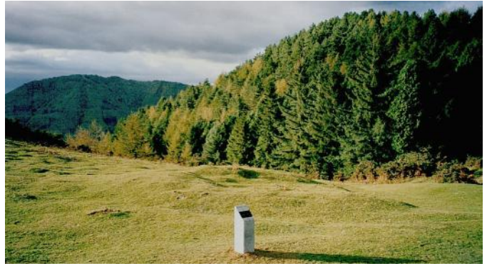
22 de Octubre de 2.002.