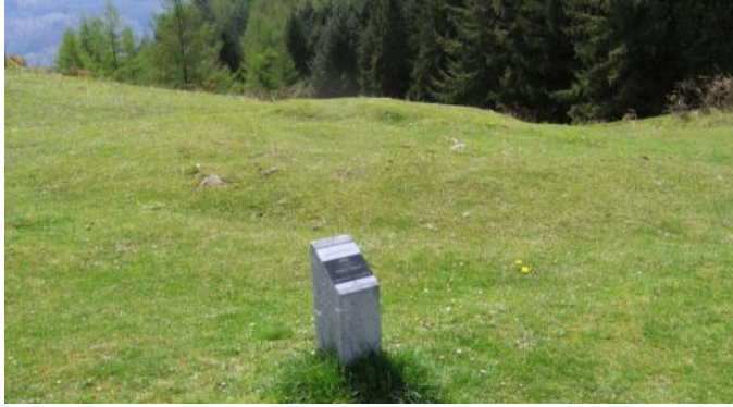
22 de Octubre de 2.002.

Zona megalítica (14): Iruarrieta | Tipo Monumento (02): Túmulo | Nº. (06): | Nombre: Oleta | Hilharriak: 20-14-02-06