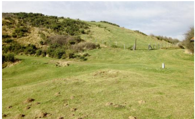
22 de Octubre de 2.002.