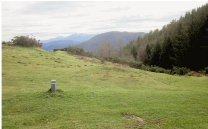
22 de Octubre de 2.002.